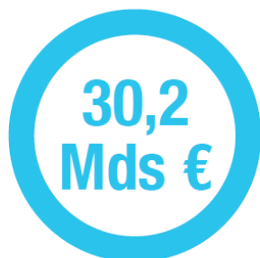
CHIFFRE D'AFFAIRES ATTENDU EN 2017

Au cours des trois dernières années, les performances du secteur de la plasturgie se sont confirmées, avec une croissance de son chiffre d'affaires de 2,8 % par an en moyenne .