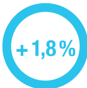
TAUX DE CROISSANCE ANNUEL MOYEN DU CHIFFRE D'AFFAIRES DE LA PLASTURGIE ENTRE 2000 ET 2017